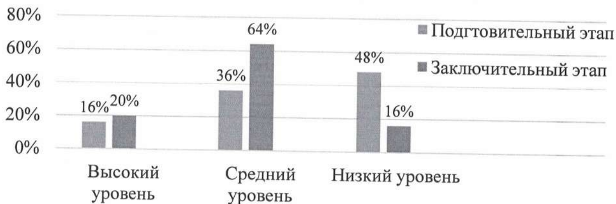
Рис. 3. Сравнительная гистограмма результатов диагностики развития когнитивных способностей у детей дошкольного возраста

Таким образом, проведенное нами работа показала, что при целенаправленном и системном применении коррекционных форм работы трудности в развитии когнитивных способностей детей дошкольного возраста возможно устранить.