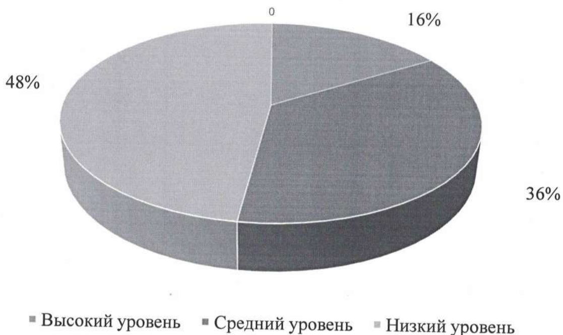
Рис. 1. Результаты первичного исследования уровня развития когнитивных способностей у детей дошкольного возраста

Таким образом, воспитанников с высоким уровнем развития когнитивных способностей выявлено 4 человека, что составило (16%) от всей группы, средний уровень развития когнитивных способностей показали 9 человек (36%) и с низким уровнем развития когнитивных способностей 12 человек (48%).