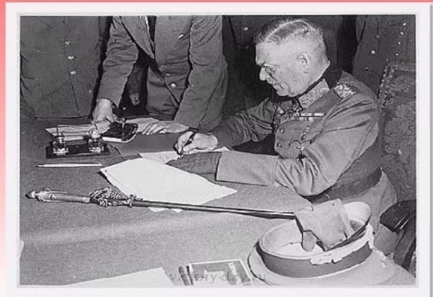
В. Кейтель подписывает Акт о безоговорочной капитуляции Германии

День Победы ведется с 9 мая 1945 года, когда в пригороде Берлина начальником штаба верховного главнокомандования генерал-фельдмаршалом В. Кейтелем от вермахта, заместителем Верховного главнокомандующего маршалом СССР Георгием Жуковым от Красной армии и