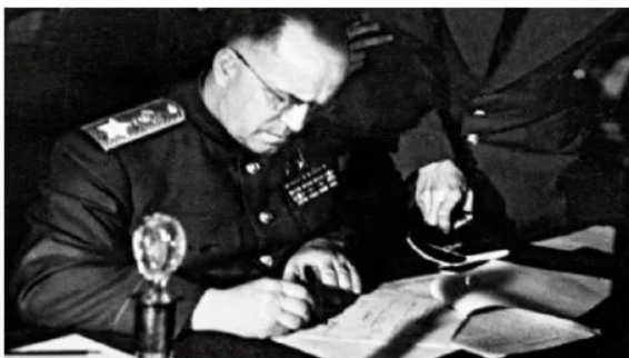
Маршал Советского Союза Георгий Константинович Жуков подписывает Акт о безоговорочной капитуляции Германии

маршалом авиации Великобритании А. Теддером от союзников, был подписан Акт о безоговорочной и полной капитуляции вермахта.